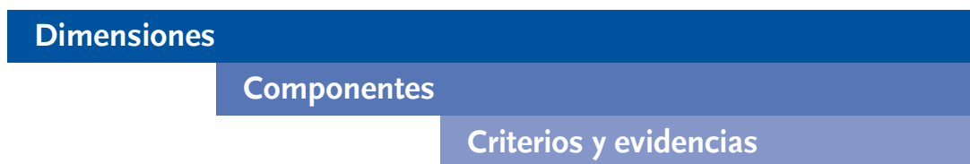
Figura No. 3. Organización de los criterios de calidad

Ningún componente se puede valorar sin un referente, por esta razón se recurre a la comparación con criterios. Debido a que, en evaluación no siempre es posible la observación directa de las características de interés, se recurre a las evidencias. Los componentes tienen tantos criterios y evidencias como se ha considerado sean necesarios para demostrar las condiciones de la carrera por acreditar. La escala de valoración de los criterios se encuentra definida en la Guía para la autoevaluación de carreras de diplomado parauniversitarias.